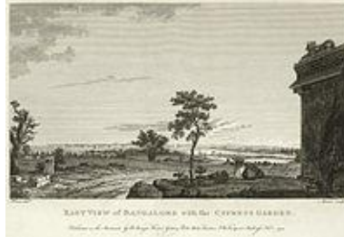
EARLY VIEW OF BANGALORE FROM THE COMPANY GARDEN.

ಇದರಲ್ಲಿ ಒಂದು ಚಿತ್ರವು ಬೆಂಗಳೂರಿನ ಆರಂಭಿಕ ದೃಶ್ಯವನ್ನು ತೋರಿಸುತ್ತದೆ.