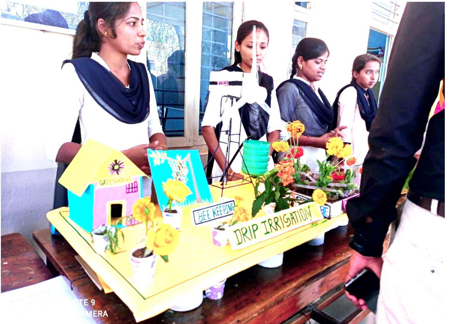
NOTE 9 CAMERA